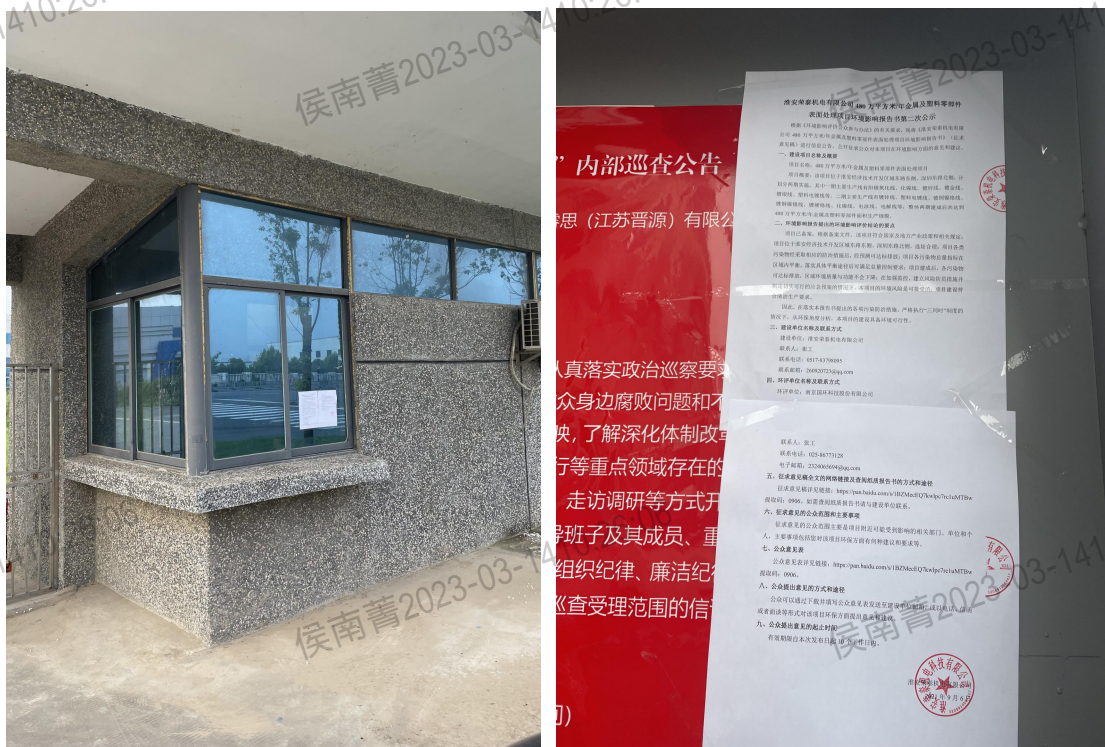
图 3.2-3 现场公告照片

根据《环境影响评价公众参与办法》第十一条中“通过在建设项目所在地公众易于知悉的场所张贴公告的方式公开，且持续公开期限不得少于 10 个工作日”的要求，在本项目征求意见稿网络公示期间，建设单位在项目厂址及淮安经济技术开发区经济发展集团有限公司公告栏进行了现场公告。详见图 3.2-3。