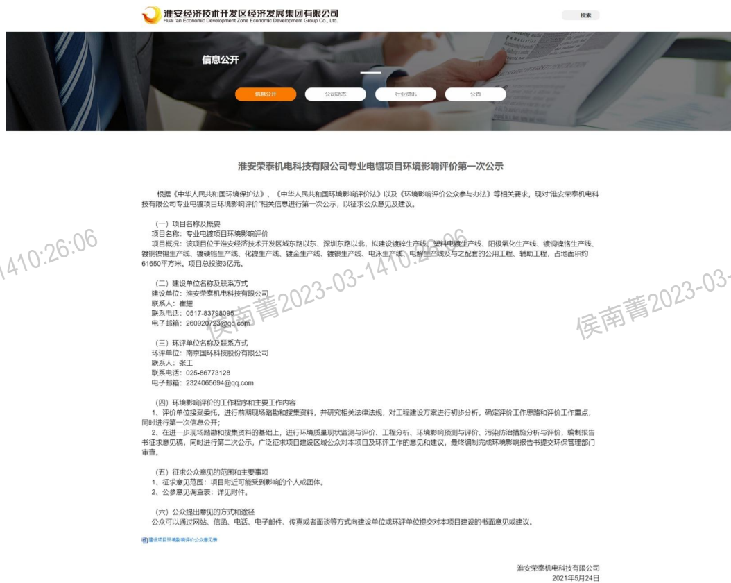
图 2.2-1 第一次网络公示截图

首次环境影响评价信息采用网络公示，公示网站为淮安经济技术开发区经济发展集团有限公司网站，网站对外公开，因此，本项目首次环境影响评价信息公示选取的网络平台符合相关要求。公示网址： http://www.hajfzgs.com/news/11943/118031.html ，首次公示网页截图见图 2.2-1。